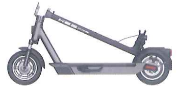
折りたたみカンタン 車のトランクにも積載 OK

サスペンション ドラムブレーキ ディスクブレーキ 電子ブレーキ 尾灯 制動灯 ナンバープレート